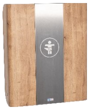
KAWA maxi, KAWA midi,